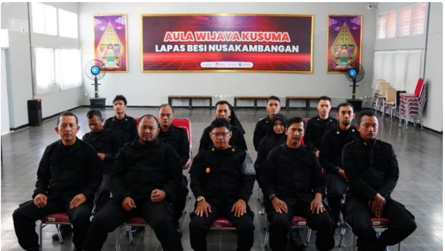
Lapas Besi Ikuti Sosialisasi Konversi Penilaian Kinerja Jabatan Fungsional

CILACAP – Lembaga Pemasyarakatan Kelas IIA Besi Nusakambangan mengikuti kegiatan Sosialisasi Konversi Penilaian Kinerja Pegawai Menjadi Angka Kredit dalam Jabatan Fungsional, (01/02/2024).